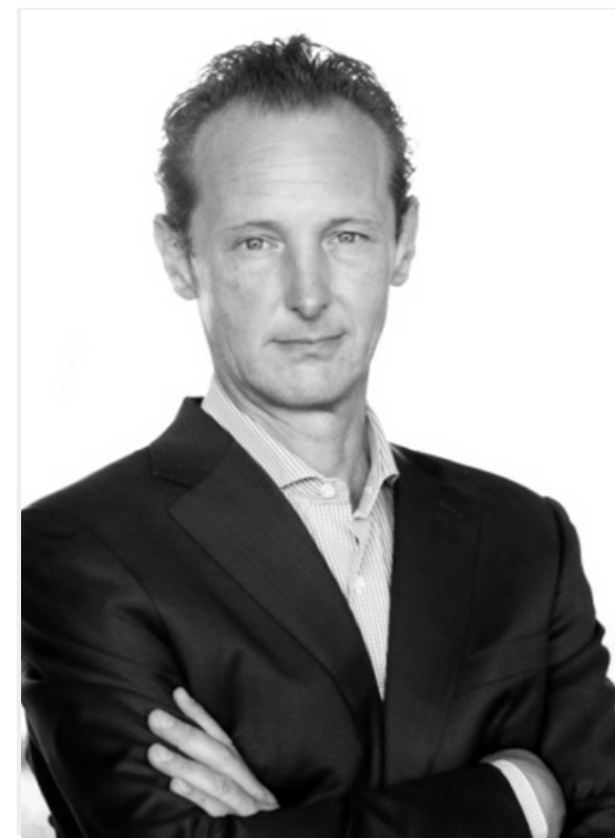
christian mur microcity sa