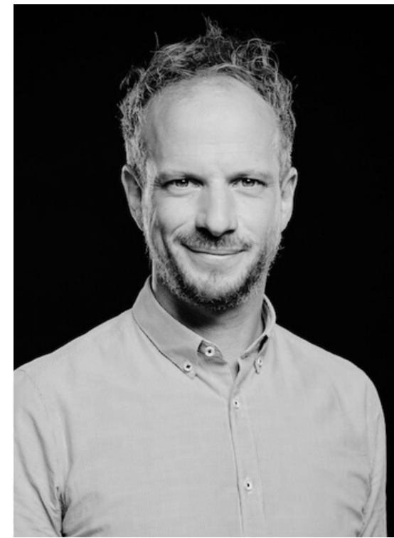
servan peca arcinfo