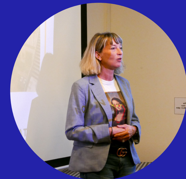
MANEGE DU TERROIR