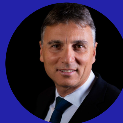
VINCENT NASSAR MANAGEMENT ET ENTREPRENARIAT