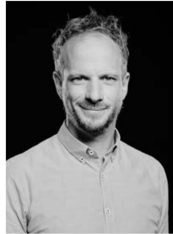
servan peca arcinfo